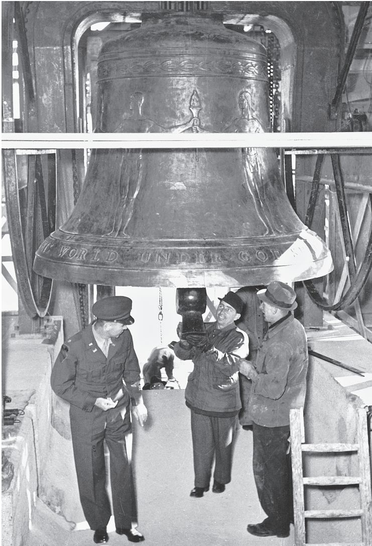
Montage der »Freiheitsglocke« im Turm des Schöneberger Rathauses, 23. Oktober 1950.