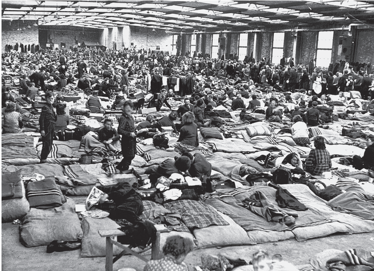
Notaufnahmela- ger in der Siegfriedstraße in Neukölln, März 1953.

vor instabil war, lastete diese Situation schwer auf den öffentlichen Finanzen. Hierdurch musste naturgemäß auch der Zustand der Unterbringungen und der Verpflegung der Flüchtlinge beeinträchtigt werden, obwohl man versuchte, so viele Menschen wie möglich in die Bundesrepublik auszufliegen – Bemühungen, die jedoch nach einem mit Bonn geschlossenen Abkommen höchstens 1.000 Personen pro Woche umfassten. Bereits Ende des Jahres 1952 telegraphierte Reuter an Dr. Reinhold Niebuhr, den einflussreichen deutsch-amerikanischen Theologen, Philosophen und Politikwissenschaftler, der zu dieser Zeit Vorsitzender des International Rescue Committee (IRC) war 37 : »I ask