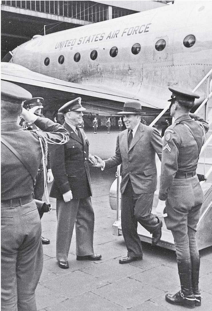
Der Hohe Kommissar für Deutschland, John J. McCloy, trifft zu seinem ersten Berlin- Besuch auf dem Flughafen Tempelhof ein, 3. Juli 1949.