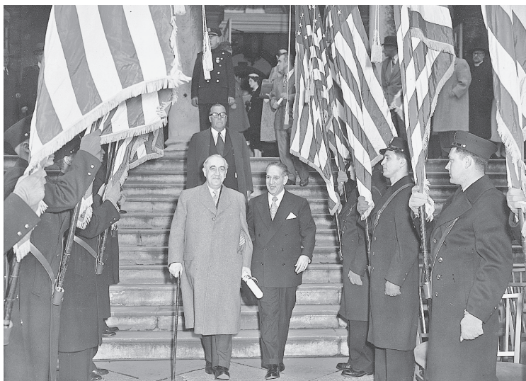
Empfang Ernst Reuters im Rathaus von New York durch Bürgermeister Vincent R. Impellitteri, 16. März 1953.