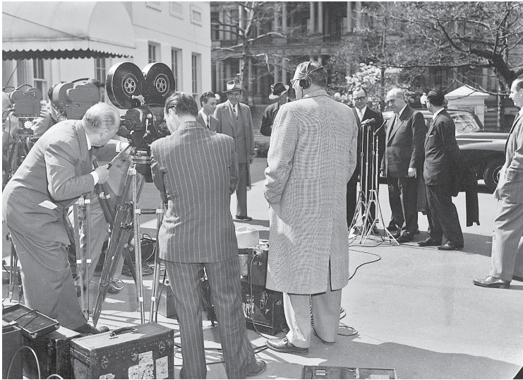
Presseinterview vor dem Weißen Haus, 20. März 1953.

tance of Berlin« im Herald Tribune abgedruckt wurde: »That is the real importance of Berlin«, hieß es dort, »Berlin is the cheapest peaceful weapon ever gained by the free Western World.« Denn: »The ›Voice of the Mayor‹ – the voice of the free Berlin – is listened to by everybody in the Soviet-occupied zone and beyond the border of this zone in the satellite states of Czechoslovakia, of Poland, of Romania, of Hungary.« 42 Die im Rahmen der Jahre 1950/51 etablierten Propagandainstitutionen in West-Berlin hatten die Stadt in dieser Lesart zu einer so effizienten und günstigen Waffe werden lassen, dass jede amerikanische Unterstützung ihren Preis in politischen Ergebnissen wieder aufzuwie-