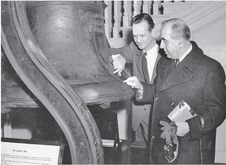
Ernst Reuter besichtigt die »Liberty Bell« in Philadelphia, 6. März 1951.

man aus Eisenhowers Worten anlässlich des Beginns des Kreuzzuges heraushören: »In this Battle for Truth, you and I have a definite part to play. During the Crusade, each of us will have the opportunity to sign the Freedom Scroll. It bears a declaration of our faith in freedom, and of our belief in the dignity of the individual, who derives the right of freedom from God. Each of us, by signing the Scroll, pledges to resist aggression and tyranny wherever they appear on Earth. Its words express what is in all our hearts. Your signature on it will be a blow for liberty.« 23