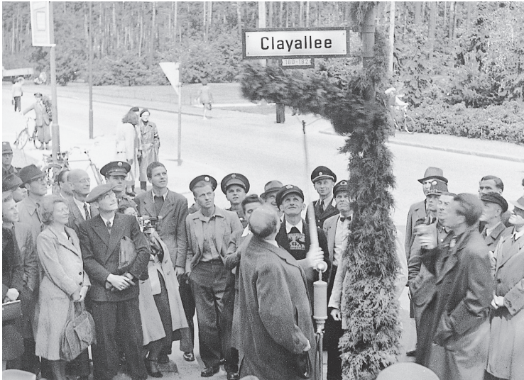
Umbenennung der ehemaligen Kronprinzen- in Clayallee, 16. Juni 1949. Oberbürgermeister Ernst Reuter enthüllt das neue Straßenschild.

Unsere Geschichte nun wurde von Akteuren beiderseits des Eisernen Vorhangs und beiderseits des Atlantiks geschrieben. Sie handelt von grenzüberschreitender, transnationaler Identitätsbildung, von Fremdwahrnehmung und Eigenwahrnehmung, und sie handelt vor allem von der Freiheit. Die Autoren ihres ersten Kapitels waren die »Rosinenbomber«, von denen einige noch heute, 64 Jahre nach dem Ende der Luftbrücke, zu historischen Rundflügen über das nunmehr in Frieden vereinte Berlin abheben. Noch während amerikanische Piloten diese ebenfalls zu historischen Symbolen gewordenen silbernen Maschinen über die sowjetische Besatzungszone nach West-Berlin steuerten, begann Ernst Reuter das Band zwischen den Amerikanern und den West-Berlinern zu festigen und das zweite Kapitel unserer Geschichte zu schreiben. Im Frühjahr 1949 brach er zum ersten Mal seit 20 Jahren in die USA auf.