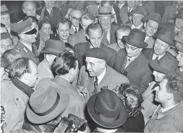
Bei seiner Rückkehr aus Amerika wird Ernst Reuter auf dem Flughafen Tempelhof von den Berlinern empfangen, 31. März 1953.

der amerikanischen Öffentlichkeit das Schicksal seiner Stadt in die Narrative des globalen, moralisch fundierten Kampfes der Vereinigten Staaten gegen die sowjetische Diktatur einbettete und so verwobene Geschichte schuf, deren Nachwirkung teils immer noch anhält. Es gelang ihm schließlich, weil er das Interesse der amerikanischen Administration an seiner Person sowie an der ehemaligen Reichshauptstadt richtig zu interpretieren wusste: Die Legitimierung des außenpolitischen Kurses innerhalb der eigenen Wählerschaft und der Wert West-Berlins als Plattform der vor allem psychologischen Kriegsführung inmitten des Ostblocks, als Außenposten der Freiheit hinter dem Eisernen Vorhang.