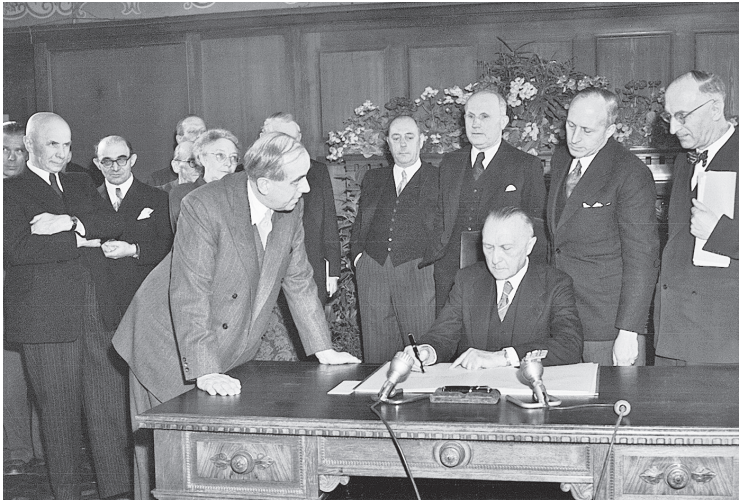
Bundeskanzler Konrad Adenauer trägt sich in das Goldene Buch der Stadt Berlin ein, 16. April 1950.

strengthen the more democratic elements in the new federal government. [...] There is precious little in the political parties in Western Germany to give us any great confidence about the future attitude of the German government. The outlook of the Berliners is more sane and more sound than that of any other Germans [...]. 17 Acheson schrieb an McCloy, sein Ministerium sei der Ansicht, dass Berlin enorme politische Aufmerksamkeit verdiene und sein demokratisierender Einfluss auf Westdeutschland dringend benötigt werde. 18