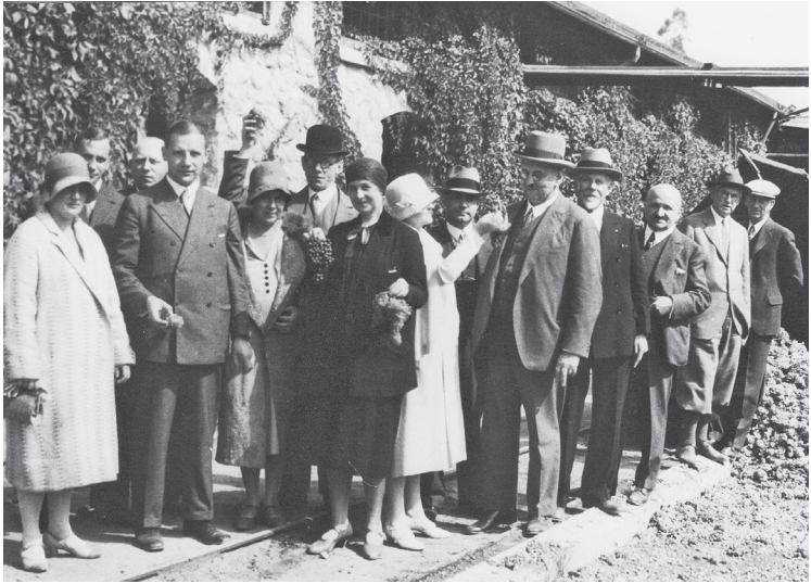
Besichtigung eines kalifornischen Weingutes, Okto- ber 1929.

Mauern der Trennung«, erklärte Böß in Kalifornien. »Auch der Abstand zwischen Los Angeles und Berlin wird immer geringer werden. Die Metropolen der neuen und alten Kontinente begrüßen einander schon. Weitere zehn Jahre und Los Angeles und Berlin werden [sich] noch näher sein.« 36