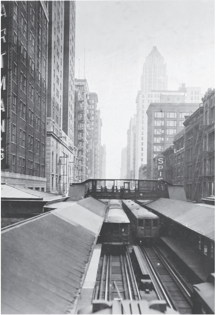
Hochbahn in Chicago, 1929.