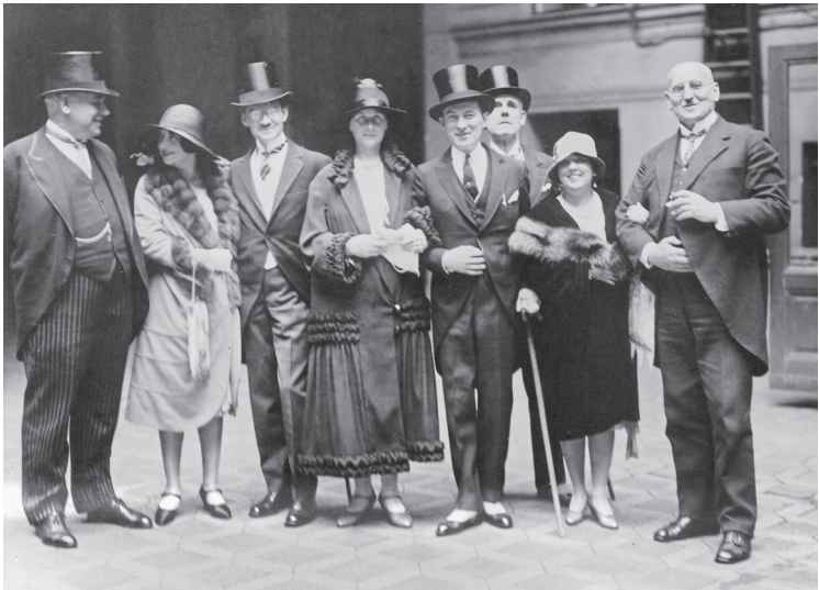
Empfang des New Yorker Bürgermeisters James J. Walker (Mitte) im Berliner Rathaus durch Gustav Böß (rechts), 25. August 1927.

öffentlicher Einrichtungen. Walker wurde von Böß nicht nur auf einem Rundgang durch das Rudolf-Virchow-Krankenhaus begleitet, wo man sich einen Eindruck von den Bedingungen des städtischen Gesundheitssystems verschaffte, er ließ sich ebenso über das U-Bahn-Netz und die Wohnungssituation unterrichten. Überschattet wurde der Besuch aber nicht allein vom schlechten Wetter – ein enger Vertrauter Walkers berichtete später von einem andauernden Platzregen, der niedergegangen sei 1 –, sondern in erster Linie von dem »Flaggenstreit«