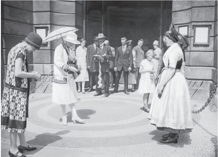
Zwei Amerikanerinnen fotografieren eine Spreewälderin in ihrer Tracht vor einem Hotel Unter den Linden, 1927.

eines jeden Franzosen sagen, dass die Vereinigten Staaten den Krieg gewonnen haben.« 14