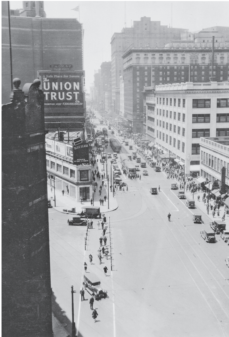
Straßenverkehr in Cleveland, 1929.