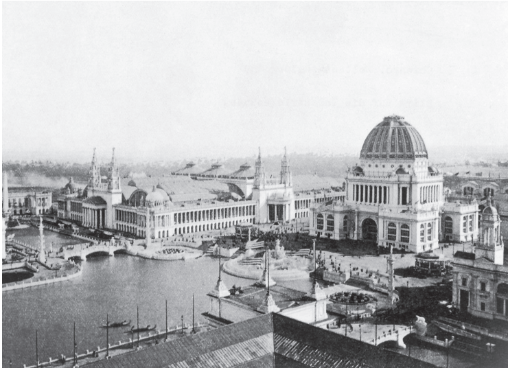
Gelände der World's Colum- bian Exposition in Chicago, 1893.