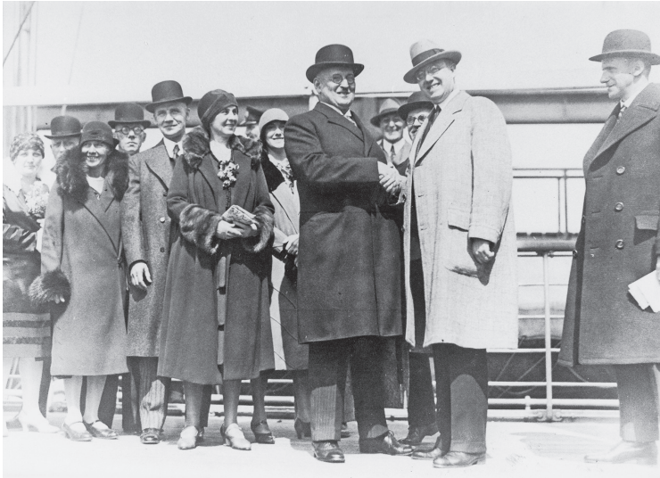
Begrüßung der Berliner Delegation mit Gustav Böß im Hafen von New York, 23. Sep- tember 1929.

Ernst Reuters wurde die Fahrt von Böß als ein Beitrag verstanden, um die diplomatischen Beziehungen zwischen dem Deutschen Reich und den Vereinigten Staaten auszubauen. Gustav Böß reiste nicht nur als Stadtoberhaupt, sondern ebenso als ein hoher Repräsentant der Weimarer Republik. In einer Zeit, als trotz der rasanten technischen Entwicklung die Fahrt über den Atlantik noch keineswegs zum Tagesgeschäft der Außenminister gehörte, wurde der Besuch eines hochrangigen Vertreters, zumal des Oberbürgermeisters der deutschen Reichshauptstadt, als eine wichtige diplomatische Angelegenheit behandelt. Offenbar hatten Gustav Stresemann und der deutsche Botschafter in Washington, Friedrich von Prittwitz und Gaffron, Böß nahegelegt, die Reise nicht zuletzt im Interesse der Diplomatie zu unternehmen. Das Auswärtige Amt war in die organisatorischen Vorbereitungen der Fahrt einbezogen. So wies die Berliner Zentrale sowohl die Botschaft