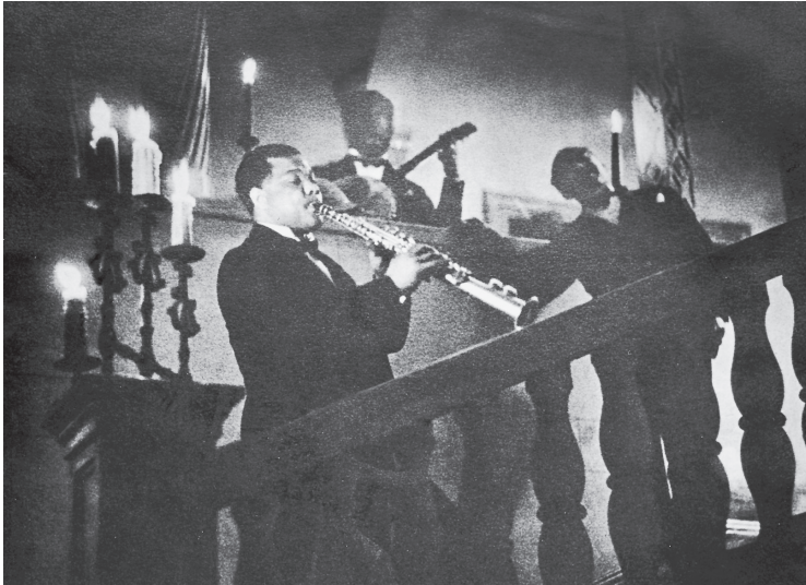
Privates Jazzkonzert mit dem Solisten Sidney Bechet in der Villa des Bankiers Goldschmidt-Rothschild in der Tiergartenstraße, 1930.

ton. Amerikanische Waren für den Massenkonsum lagen nicht nur in den Schaufenstern am Kurfürstendamm aus, sondern waren überall in der Stadt erhältlich. Regelmäßig füllten Nachrichten aus den USA die Zeitungen, in den Theatern wurden amerikanische Stücke gegeben, die Filmindustrie eiferte dem Vorbild Hollywoods nach, in den Lichtspielhäusern der Stadt zählten US-Kinofilme mit Harold Lloyd, Buster Keaton, Rudolph Valentino und Charles Chaplin zu den Lieblingswerken der Zuschauer. Nach einem Besuch in Berlin 1928 stellte der Schriftsteller Joseph Wood Krutch deshalb mit großem Erstaunen fest: »Keine andere europäische Stadt, die ich je gesehen habe, sieht so sehr wie New York aus, und der Aufwand, um es so aussehen zu lassen, ist kontinuierlich und bewusst. [...] Wenn die Zeit kommt [...], wenn die Berliner Milch zum Mittagessen nehmen, dann können wir ohne Furcht vor dem gereizten Widerspruch eines jeden Engländers oder