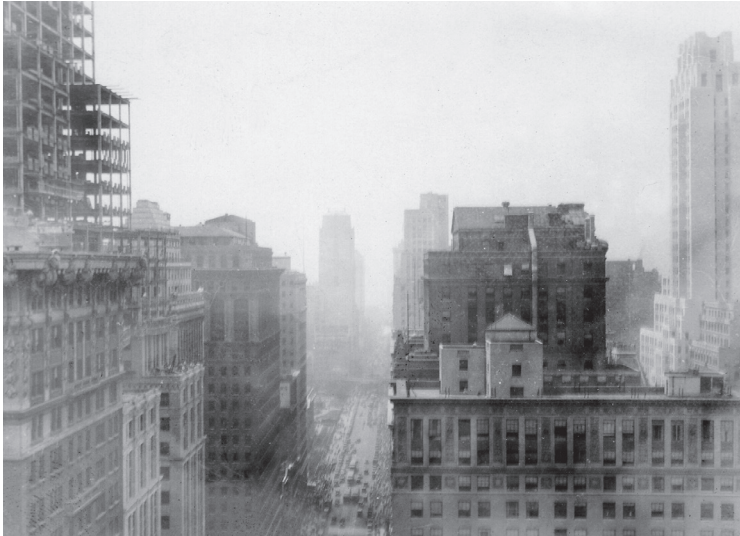
Blick vom Dach des Hotels der Delegation auf Manhattan, 1929.

wenige Tage nach der Rückkehr der Delegation ansetzte, vermittelte Ernst Reuter ein plastisches Bild von den verstopften Straßen Manhattans, wo der Verkehr aufgrund des hohen Fahrzeugaufkommens fast zum Erliegen komme. Er berichtete, dass man nach der Ankunft für die Fahrt vom Schiffsanleger an der 42. Straße zum nicht weit entfernten Hotel eineinhalb Stunden mit dem Auto benötigt habe. 23 In den vergleichsweise engen Straßen um die 5th Avenue, die auf einem Bebauungsplan aus dem frühen 19. Jahrhundert beruhten und die daher nicht für den Massenverkehr geeignet waren, kämen die Omnibusse