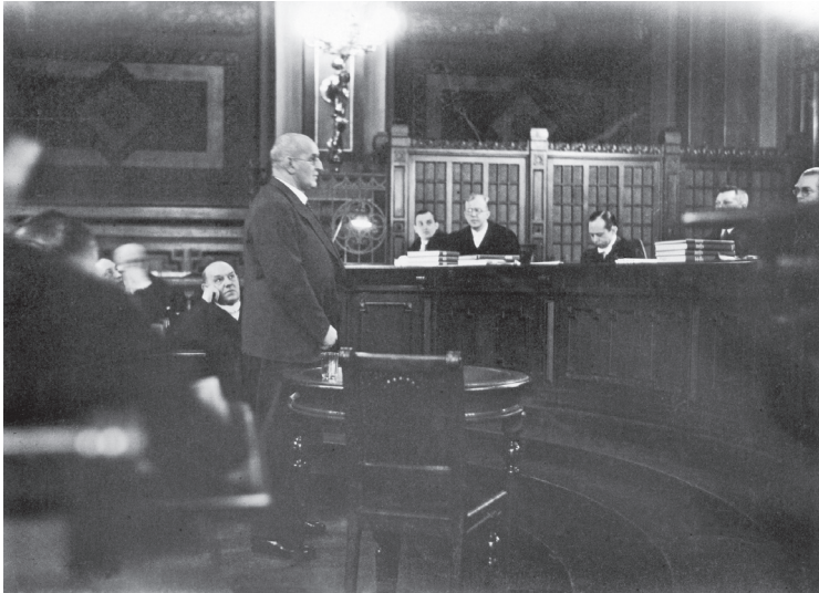
Gustav Böß als Zeuge im Sklarek-Prozess, um 1931.

schen Raum, insbesondere aus China und Japan, abgelöst. 44 Die neuen Machthaber in Deutschland zeigten nur ein geringes Interesse, die Kontakte mit den amerikanischen Städten aufrechtzuerhalten. Im Bereich des Fremdenverkehrs verloren die Vereinigten Staaten ebenfalls ihren Spitzenplatz. Selbst im Umfeld der Olympischen Spiele von 1936 konnten die Touristenzahlen der späten 1920er Jahre nicht mehr erreicht werden.