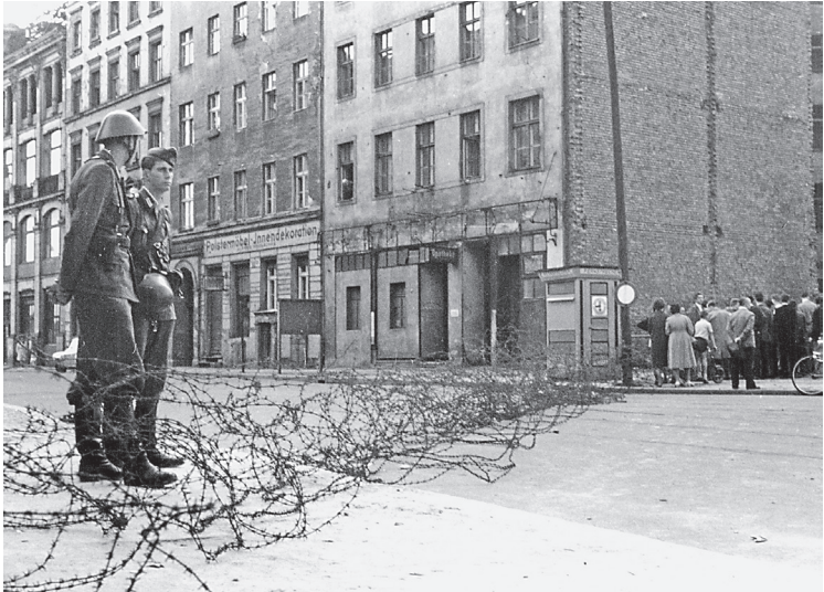
Erste Absper- rungen in der Dresdener Straße, 13. August 1961.