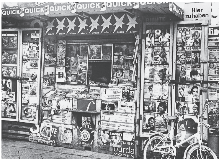
Zeitungskiosk in der Martin-Luther-Straße in Berlin-Schöneberg, Juni 1969.

Haffner stand darüber hinaus wie kein anderer für einen deutlichen Meinungswechsel in der Deutschlandpolitik. Diesen hatte der Kolumnist in einer Hörfunksendung des SFB öffentlich gemacht. Er forderte als ersten Schritt zur Wiedervereinigung den Austritt der Bundesrepublik aus der NATO sowie den der DDR aus dem Warschauer Pakt. Nur mit einer solchen »Realpolitik« konnte man seiner Meinung nach die Mauer wirklich »loswerden«: »Man muss auch den Mut haben, eine Niederlage eine Niederlage zu nennen und Konsequenzen daraus zu ziehen. Trotz allein ist keine Politik.« 11 Das bedeutete für Haffner