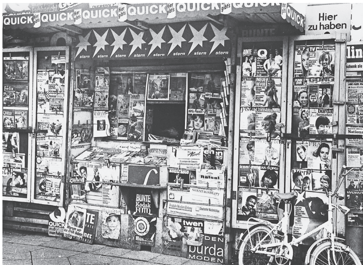
Zeitungskiosk in der Martin-Luther-Straße in Berlin-Schöneberg, Juni 1969.

Haffner stand darüber hinaus wie kein anderer für einen deutlichen Meinungswechsel in der Deutschlandpolitik. Diesen hatte der Kolumnist in einer Hörfunksendung des SFB öffentlich gemacht. Er forderte als ersten Schritt zur Wiedervereinigung den Austritt der Bundesrepublik aus der NATO sowie den der DDR aus dem Warschauer Pakt. Nur mit einer solchen »Realpolitik« konnte man seiner Meinung nach die Mauer wirklich »loswerden«: »Man muss auch den Mut haben, eine Niederlage eine Niederlage zu nennen und Konsequenzen daraus zu ziehen. Trotz allein ist keine Politik.« 11 Das bedeutete für Haffner