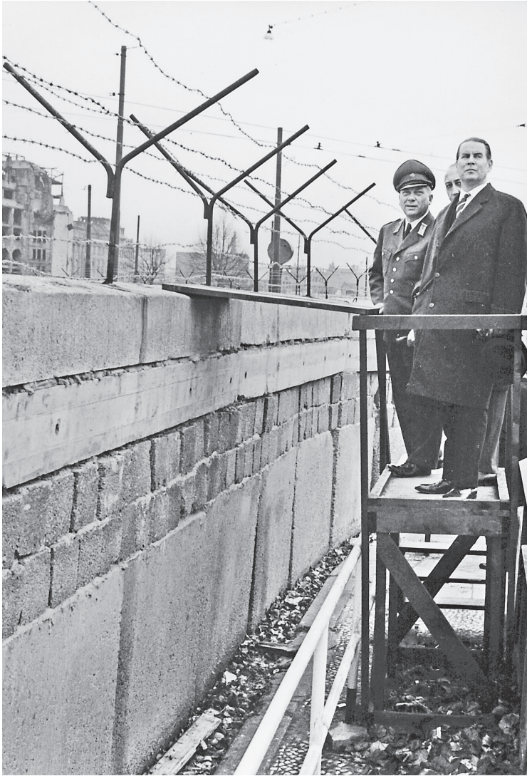
Bundesaußenminister Gerhard Schröder (rechts) besichtigt die Sektorengrenze am Potsdamer Platz, 18. November 1961. Neben Schröder der Kommandeur der West-Berliner Schutzpolizei Erich Duensing.