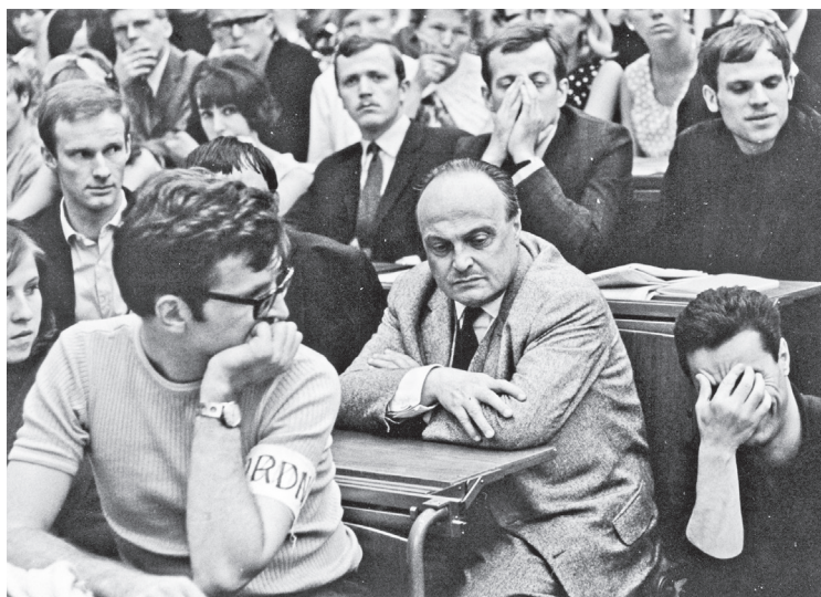
Sebastian Haffner (Mitte) besucht eine Informationsveranstaltung in der Technischen Universität Berlin zu den Studentendemonstrationen anlässlich des Schah-Besuchs, 30. Juni 1967.