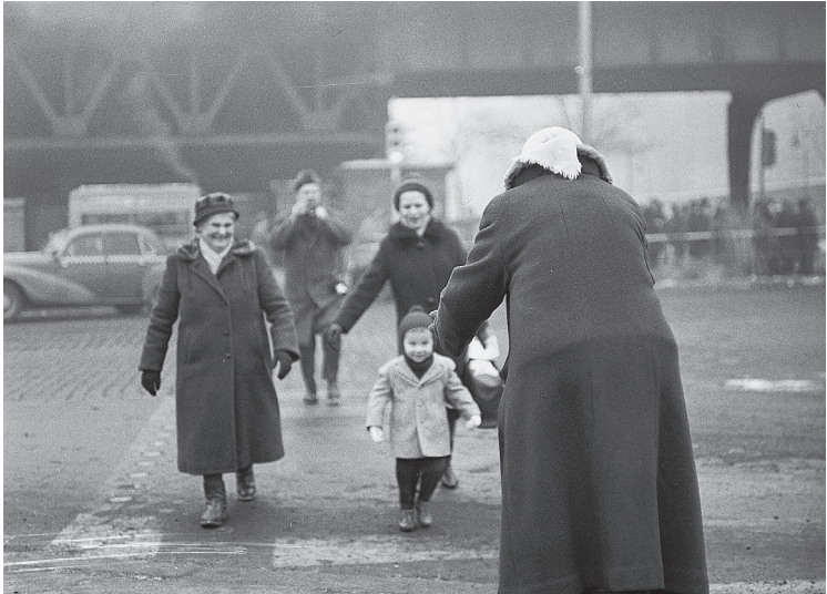
Wiedersehen am Grenzübergang Oberbaum- brücke, Dezem- ber 1963.

Den losgelösten Emotionen dieser Tage konnte sich auch ein profiliertes Kritiker der Annäherungspolitik wie Matthias Walden nicht entziehen. In einer 30-minütigen Fernsehdokumentation würdigte er das Passierscheinabkommen als »unglaubliches, fast unbegreifliches Ereignis«. Er wies aber gleichzeitig darauf hin, dass das SED-Regime nach einer erfolgten politischen Anerkennung solche Akte der »kontingierten Menschlichkeit« nicht mehr zu leisten bräuchte, sondern stattdessen die Teilung betonieren würde. 33 Für Sebastian Haffner hingegen gingen die Besuchsvereinbarungen noch nicht weit genug. Deutsch-deutsche Gespräche auf Ministerebene müssten es schon sein, wolle