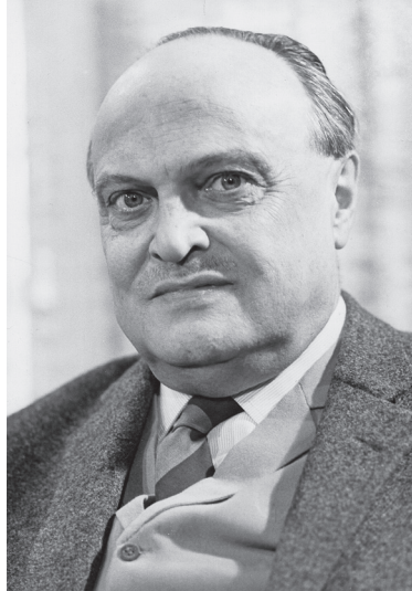
Sebastian Haffner, 1968.

pektive – hätten allerdings schon einmal bewiesen, dass sie diesen nicht besäßen, womit er auf die Masseneintritte in die NSDAP zu Beginn der 1930er Jahre anspielte. 3