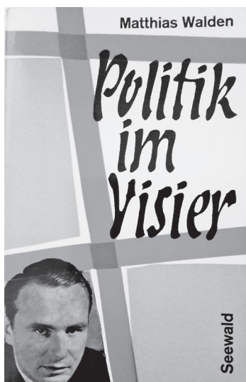
Cover des Buches Politik im Visier von Matthias Walden, 1965.

Untereinander, so versicherten sich Haffner und Walden, waren sie jedoch frei von »persönlichen Ressentiments«. 22 Der Stern -Kolumnist äußerte im Frühjahr 1964 sogar die Hoffnung, dass die beiden Journalisten sich in ihrer Meinung einmal wieder näher kommen könnten. Walden hatte ihm zuvor geschrieben: »Der scharfe und polemische Gegensatz, der zwischen Ihrer und meiner Arbeit seit einiger Zeit entstanden ist, blieb bei mir zu meiner eigenen Freude immer ohne jede Spur einer persönlichen emotionalen Antipathie, Verklemmung oder gar Aversion.« 23