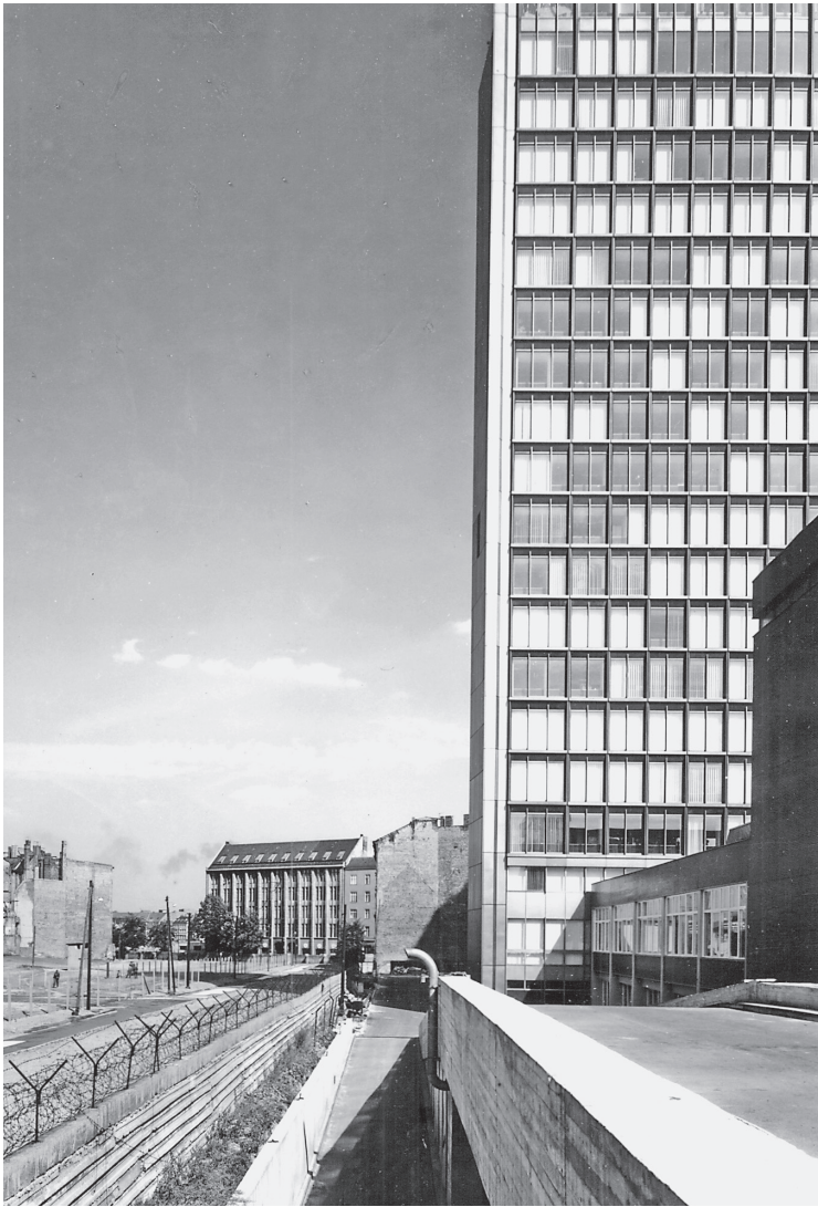
Das Axel Springer Verlagshochhaus kurz vor der Fertigstellung an der Berliner Mauer, August 1966.