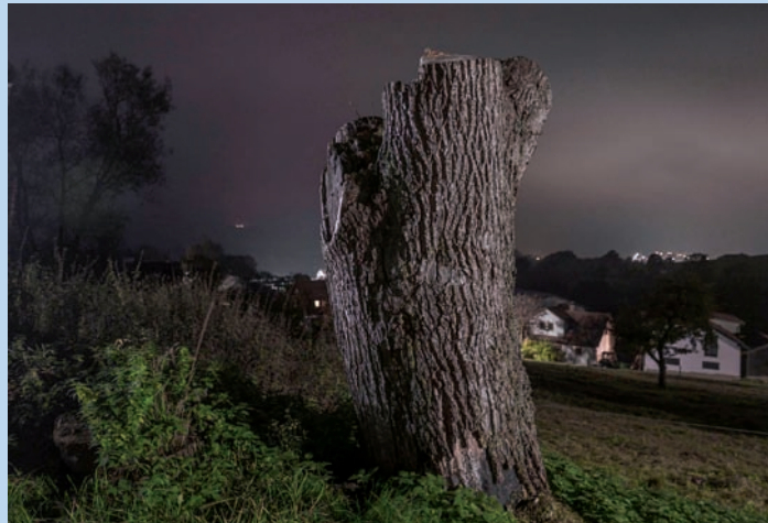
Baumstumpf in Sandberg

Nächtliche Fotos, die Städte, Landschaften und Gebäude im subtilen Licht der Nacht inszenieren, bildeten in den vergangenen Jahren den Schwerpunkt seiner fotografischen Arbeit. Zuletzt wurden die eindrucksvollen Nachtfotografien von Detlef Bluhm in den Ausstellungen »Sandberg: Ein Dorf im Glanz der Nacht« und »Gersfeld: Nächtliche Erkundungen« gezeigt. Derzeit in Arbeit ist das Projekt »Ljubljana im Glanz der Nacht«.