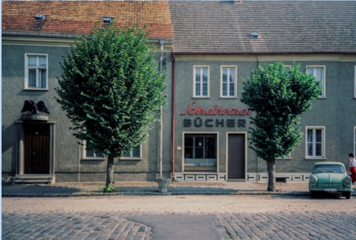
Schreibwaren- und Buchhandlung Ziesar