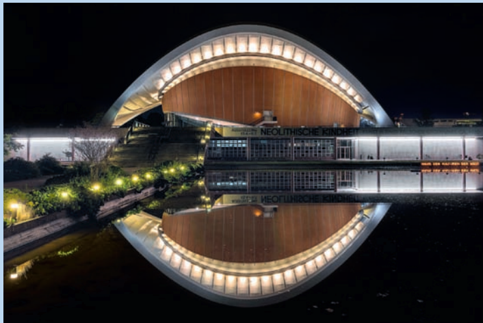
Haus der Kulturen der Welt

Im Licht der Nacht und aus ungewöhnlichen Perspektiven fotografiert, zeigt sich die Stadt ganz anders, als man sie kennt. Detlef Bluhms Fotografien von stillen Parks und illuminierten Bürohäusern, von weltbekannten Sehenswürdigkeiten und tagsüber unscheinbaren Industrieanlagen überraschen und begeistern.