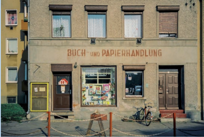
Buch- und Papierhandlung Wriezen