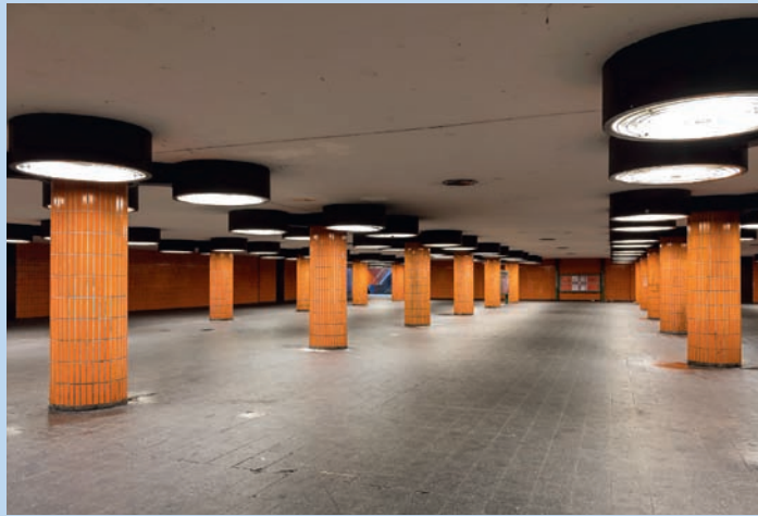
Fußgängerunterführung am Messedamm

Berlin scheint niemals zu schlafen. Doch das stimmt nicht so ganz. In seinem ersten Bildband »Berlin im Glanz der Nacht« nimmt Detlef Bluhm uns mit auf menschenleere Straßen und Plätze, auf Dächer und Balkone, in nachts eigentlich unzugängliche Gebäude - und zeigt uns vermeintlich Bekanntes ganz neu.