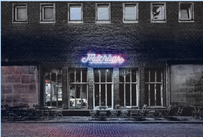
Milchbar im Funkhaus Berlin

Berlin scheint niemals zu schlafen. Doch das stimmt nicht so ganz. In seinem ersten Bildband »Berlin im Glanz der Nacht« nimmt Detlef Bluhm uns mit auf menschenleere Straßen und Plätze, auf Dächer und Balkone, in nachts eigentlich unzugängliche Gebäude - und zeigt uns vermeintlich Bekanntes ganz neu.