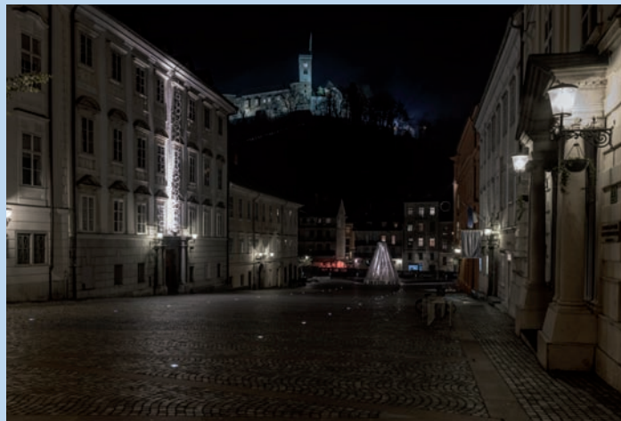
Burg von Ljubljana