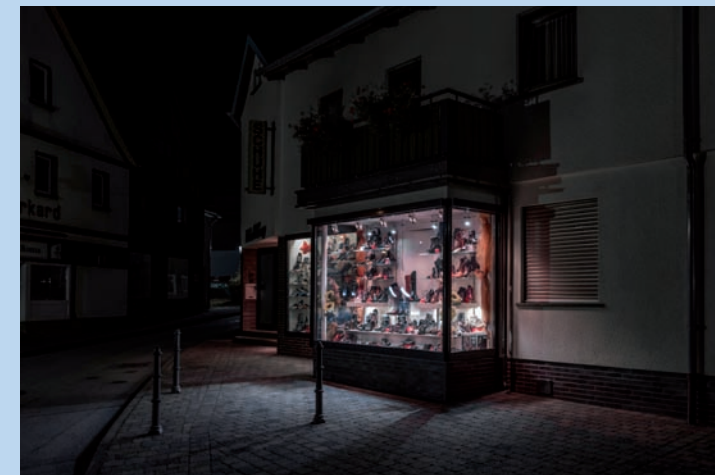
Schuhgeschäft in Gersfeld