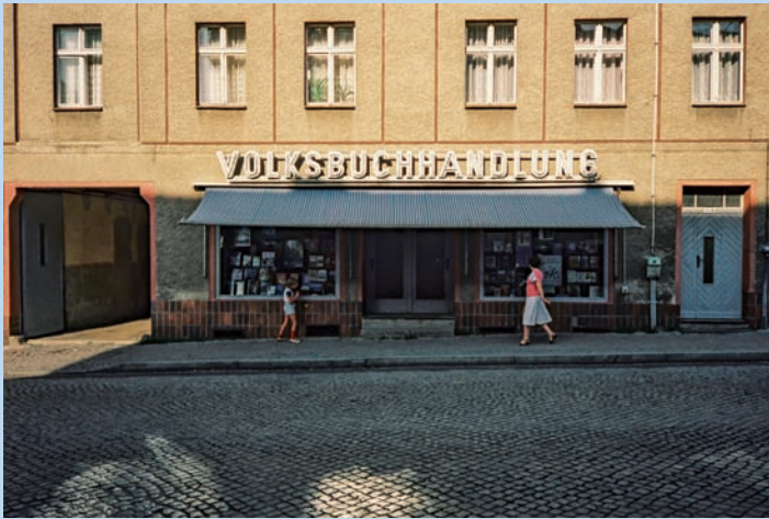
Volksbuchhandlung Bad Freienwalde