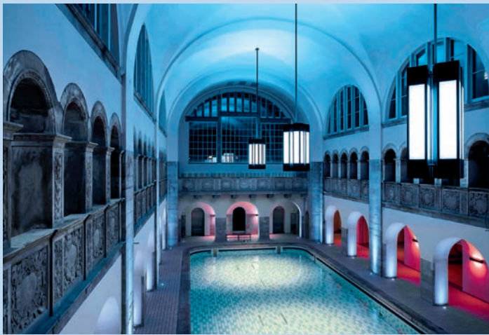
Stadtbad Oderberger Straße

Im Licht der Nacht und aus ungewöhnlichen Perspektiven fotografiert, zeigt sich die Stadt ganz anders, als man sie kennt. Detlef Bluhms Fotografien von stillen Parks und illuminierten Bürohäusern, von weltbekannten Sehenswürdigkeiten und tagsüber unscheinbaren Industrieanlagen überraschen und begeistern.