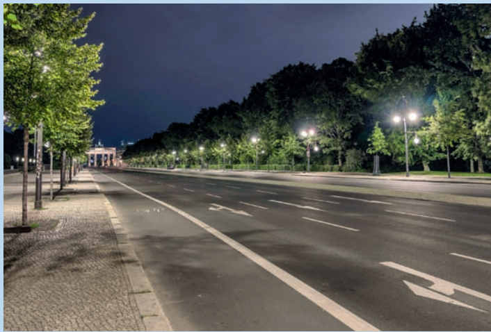
Straße des 17. Juni